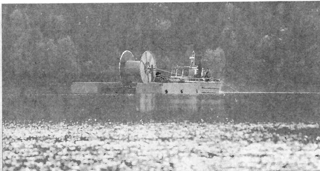
LEGGER NORGES LENGSTE KABEL: Her legges Telenors tilførselskabel for bredbånd på bunnen i Engersjøen mellom Heggertset og Engerneset. Fartøyet måtte kjøre mye siksakk på sin rute, på grunn av mye nøter og nett, som ligger på kryss og tvers i sjøen.